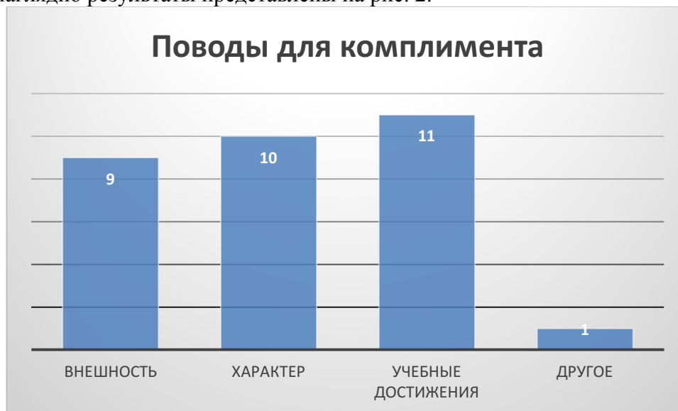
Рис. 2. Поводы для комплиментов одноклассникам.

Более наглядно результаты представлены на рис. 2.