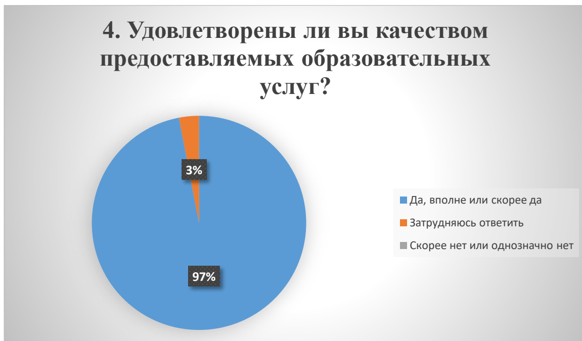
Рис. 4. Оценка качества предоставляемых образовательных услуг