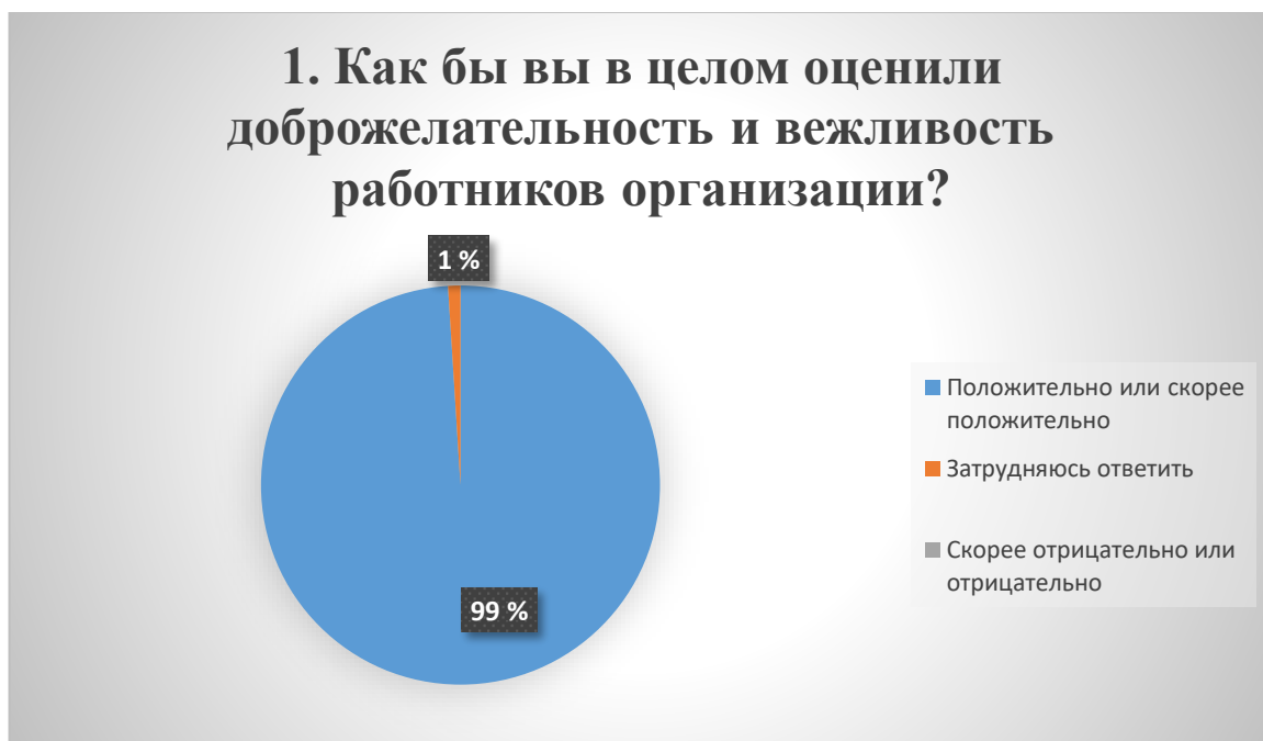
Рис. 1. Оценка доброжелательности и вежливости

Для наглядности на рис. 1-5 представляем результаты в форме диаграмм.