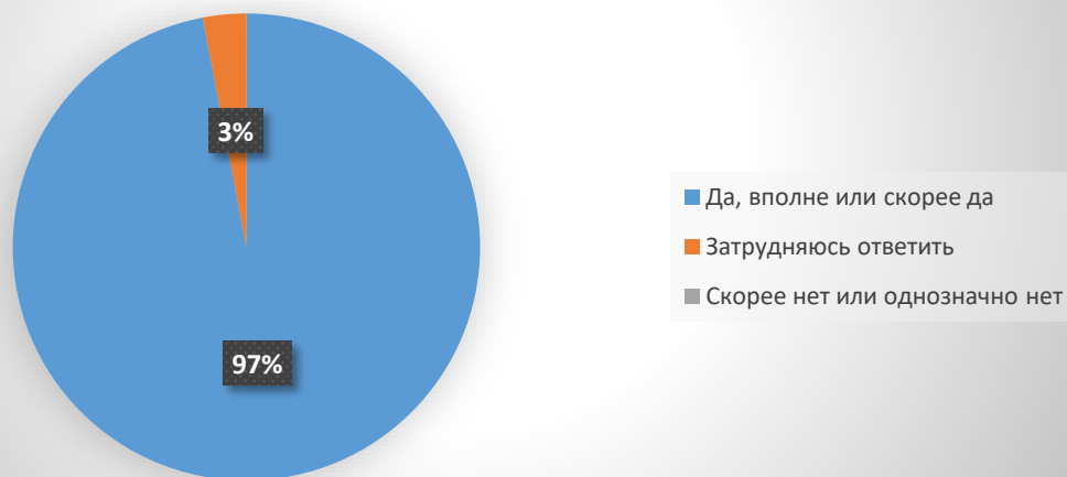
Рис. 2. Оценка компетентности работников